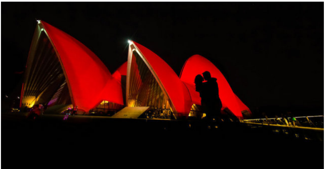
2017年获奖作品欣赏：悉尼歌剧院中国 之恋。悉尼歌剧院中国红之夜吸引了大量的游客前来观赏，一对情侣在这