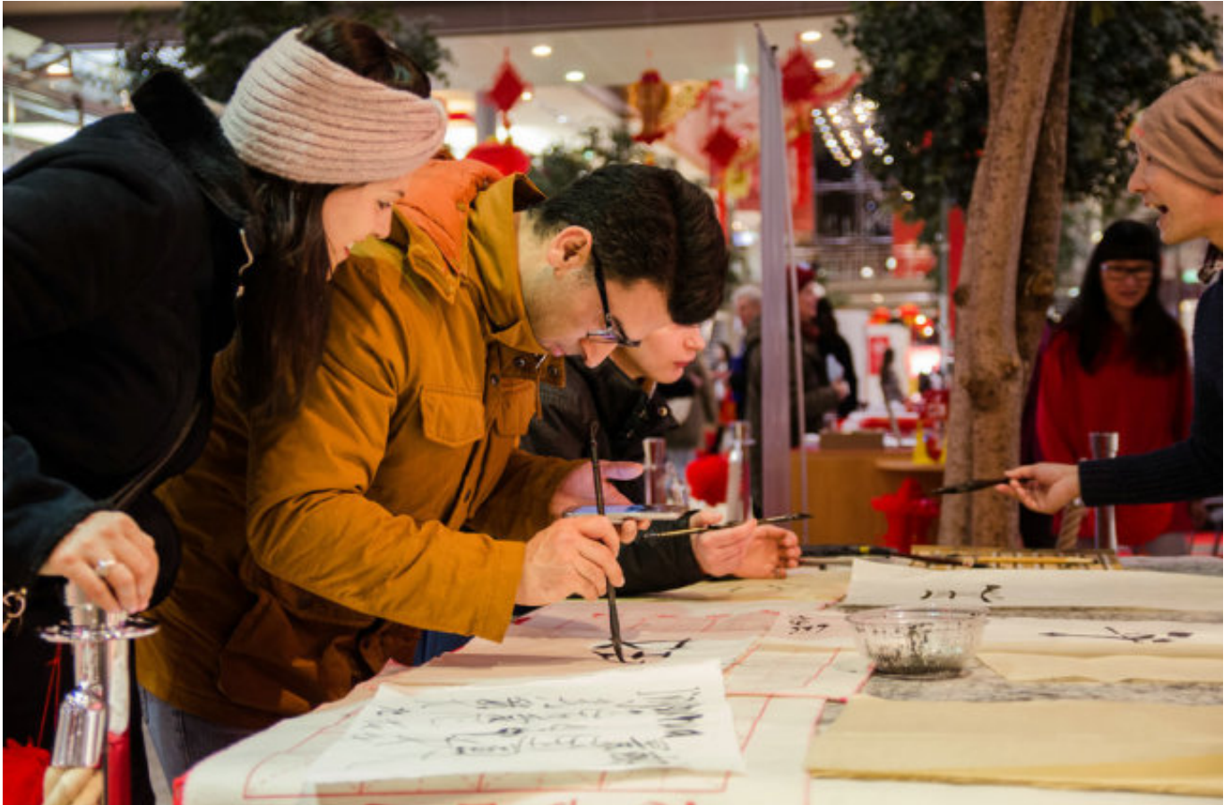
2017年获奖作品欣赏：2017年1月12日至14日，欢乐春节庆祝活动走进德国柏林波茨坦广场。