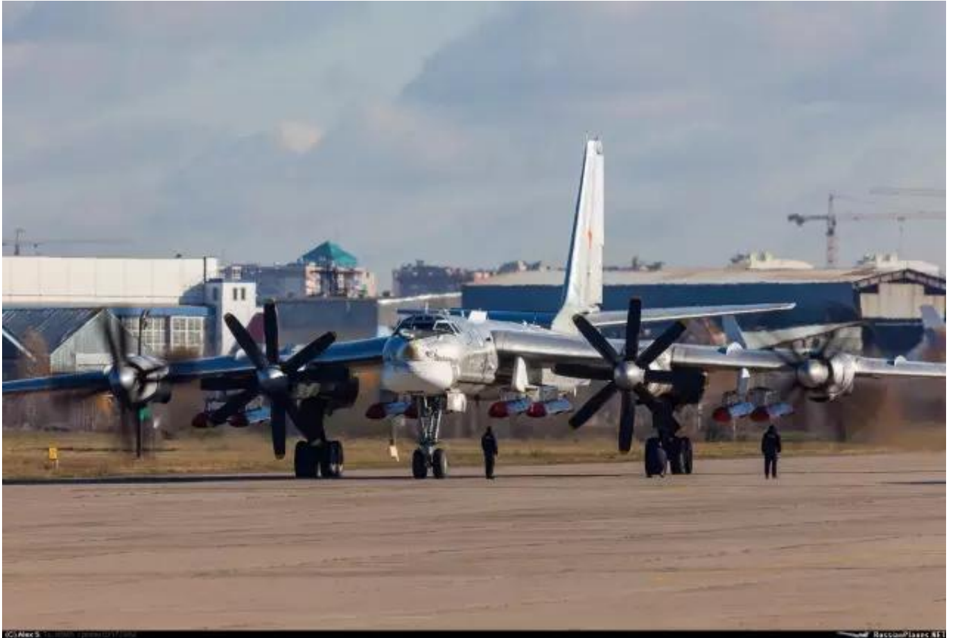
图：图-95携带8枚Kh-101/102的样子，阻力可想而知

具体会如何影响呢？北国防务（微信ID: sinorusdef）认为，这或许可以参照图-142，根据官方公开的信息，图-142在外挂6枚重600千克的Kh-35反舰导弹时，航程将下降20%；在外挂6枚重约2500千克（与Kh-101/102类似）的“宝石”/“布拉莫斯”反舰导弹时，航程将下降40%。以此推测，图-95在外挂8枚Kh-101/102时，其航程很可能只有7000千米（无外挂时航程约10500千米）。