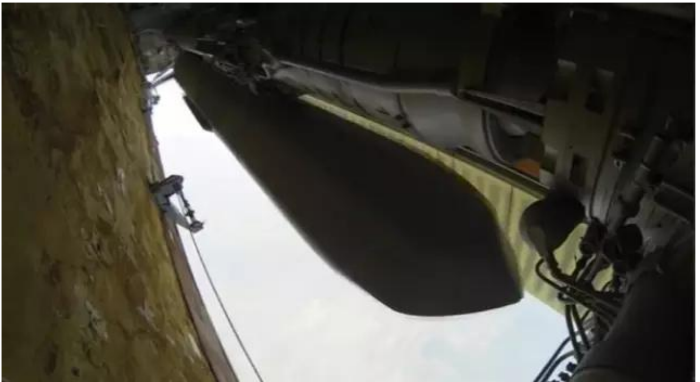
图：去年图-160在对叙行动中发射Kh-101

在这一背景下，2015年11月17-20日的连续4天，俄罗斯空天军出动5架图-160和6架图-95MS战略轰炸机，向位于叙利亚的极端组织怒射48枚Kh-101和35枚Kh-555常规战略巡航导弹。