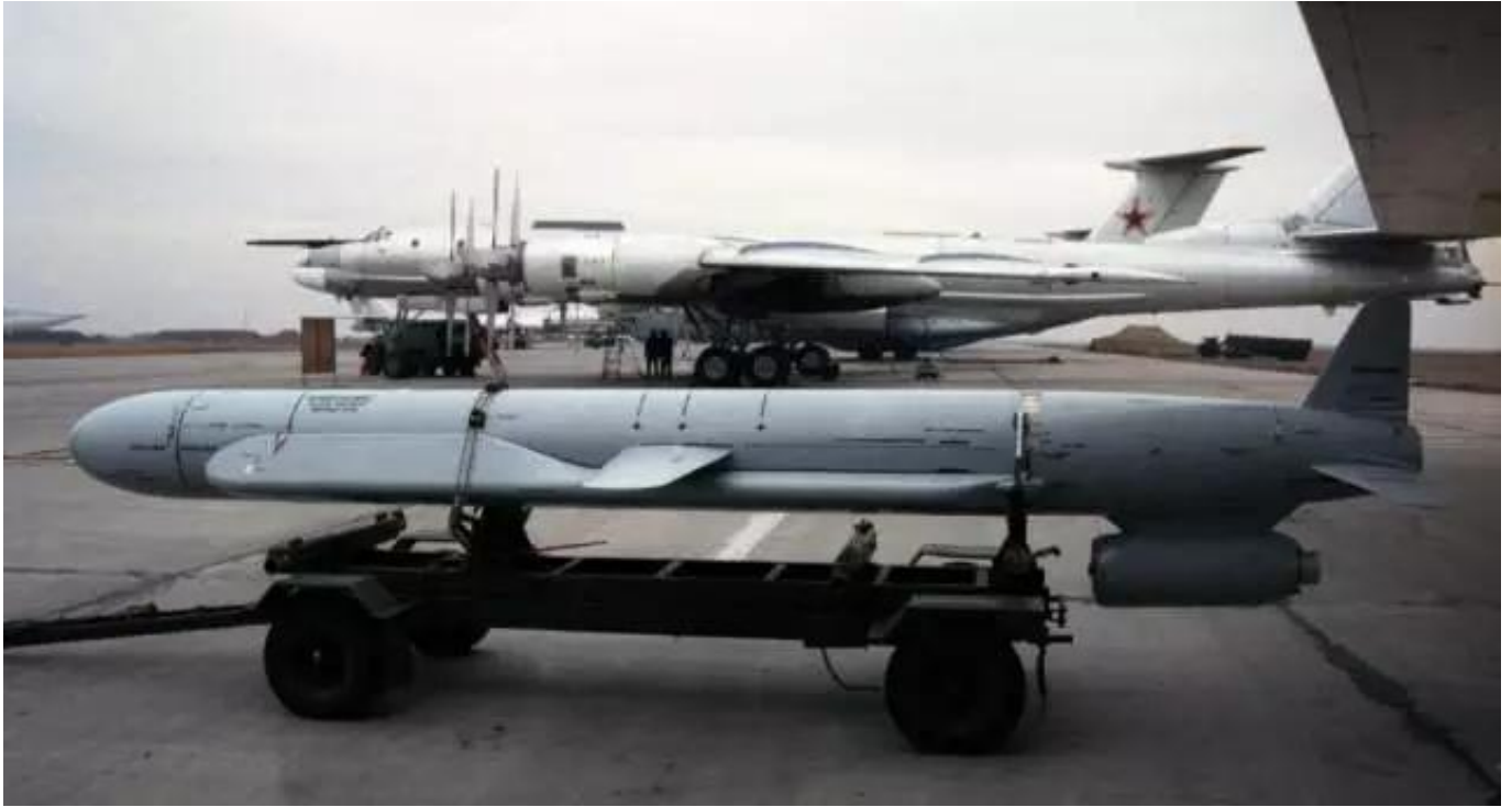
图：2003年前，带保形油箱的Kh-55SM是图-95的主要武器，主要用于核威慑

在适配Kh-555的同时，图-95也在进行适配Kh-101/-102新型导弹的工作。因为图-95的弹舱小无法容纳Kh-101/102，相关的改进工作较大，这也就是现在的图-95MSM。