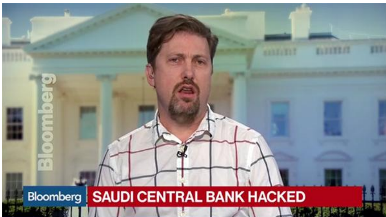
Saudi Central Bank Said Struck by Iran Malware