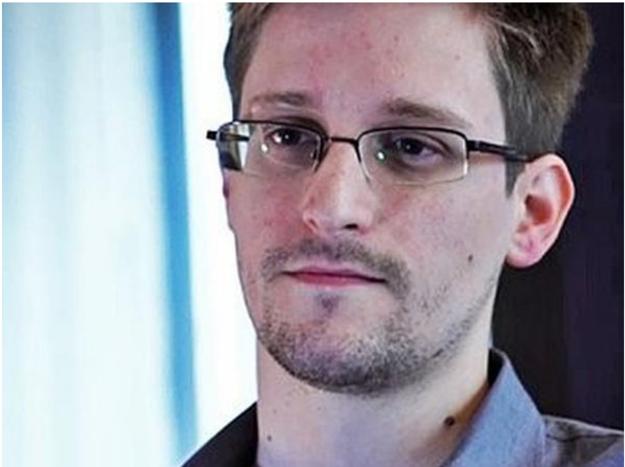
斯诺登曾多次透露美国的网络攻击计划

【观察者网综合】近日，继日本自卫队网络遭受黑客攻击后，俄罗斯和沙特阿拉伯的金融机构也遭到了网络攻击。俄罗斯央行官员2日称，该行代理账户遭黑客袭击，被盗取了20亿俄罗斯卢布(约合3100万美元)资金。而彭博社1日报道，沙特阿拉伯遭到“可能”有伊朗政府背景的黑客的袭击，多个不同网络部位的“网络炸弹”被同时引爆，造成数据丢失、国家机场管理系统瘫痪等后果。