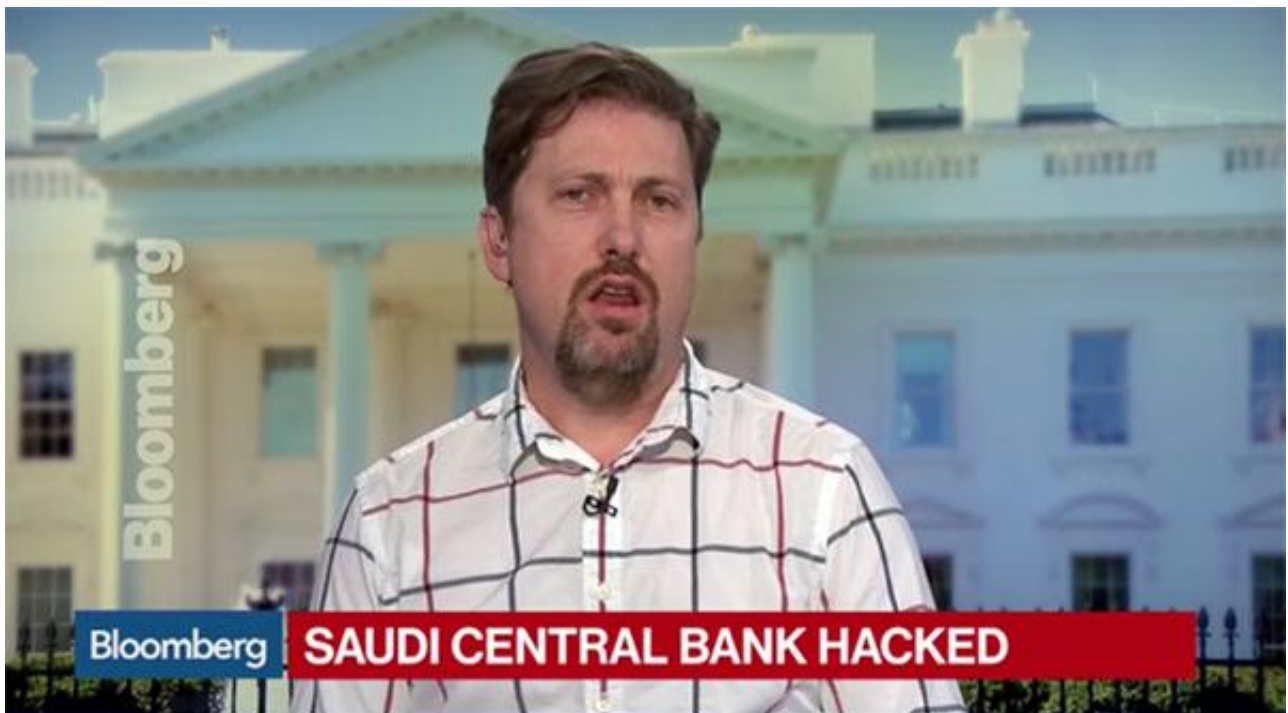
Saudi Central Bank Said Struck by Iran Malware