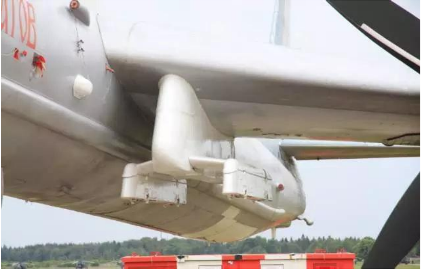
图：图-95MSM的专用挂架特写

值得注意的是，俄军称图-95MSM在行动中经过了2次空中加油，图-95不是号称航程超一万公里吗？怎么要加2次油？这背后涉及到一个问题——外挂导弹令图-95的航程大打折扣。