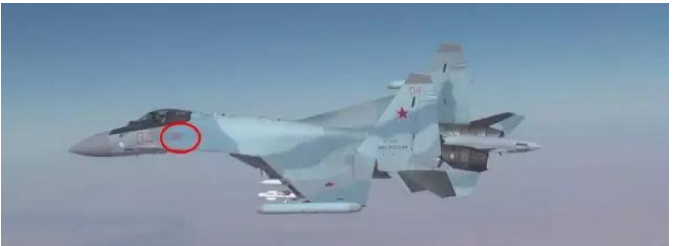
图：视频中的“红色04”号苏-35S，注意左侧前机身的星，应该有35-40颗