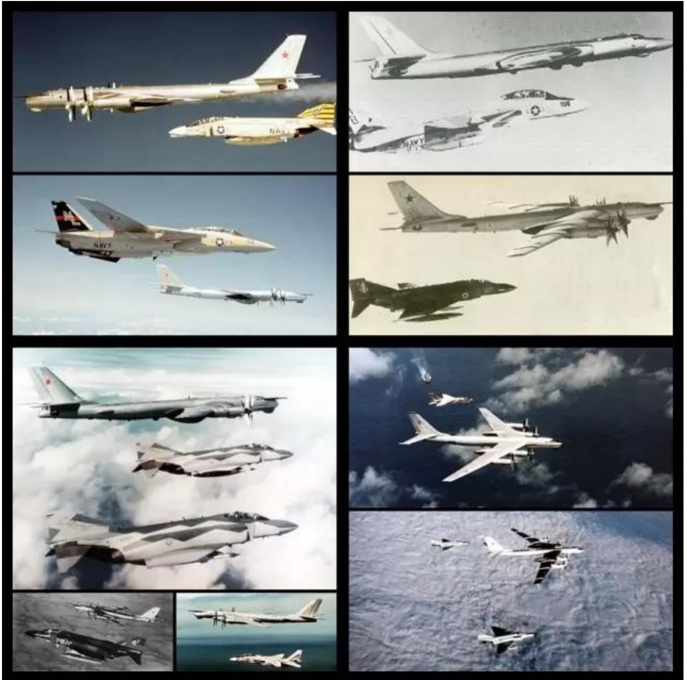
图：依次为上世纪60、70、80年代，以及本世纪图-95会过的部分西方战机，其中上世纪90年代忙解体，没空和西方玩儿。

值得注意的是，图-95MSM此次出动前不久（11月12日）刚好是图-95首飞64周年。这一甲子，图-95会遍了西方几乎所有主要战机。