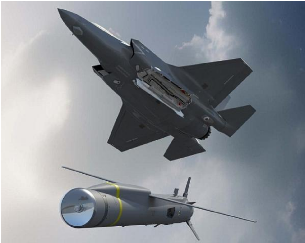
英国空军“长矛3”导弹其实是一种小型导弹，采用红外制导，用来反舰也就是聊胜于无