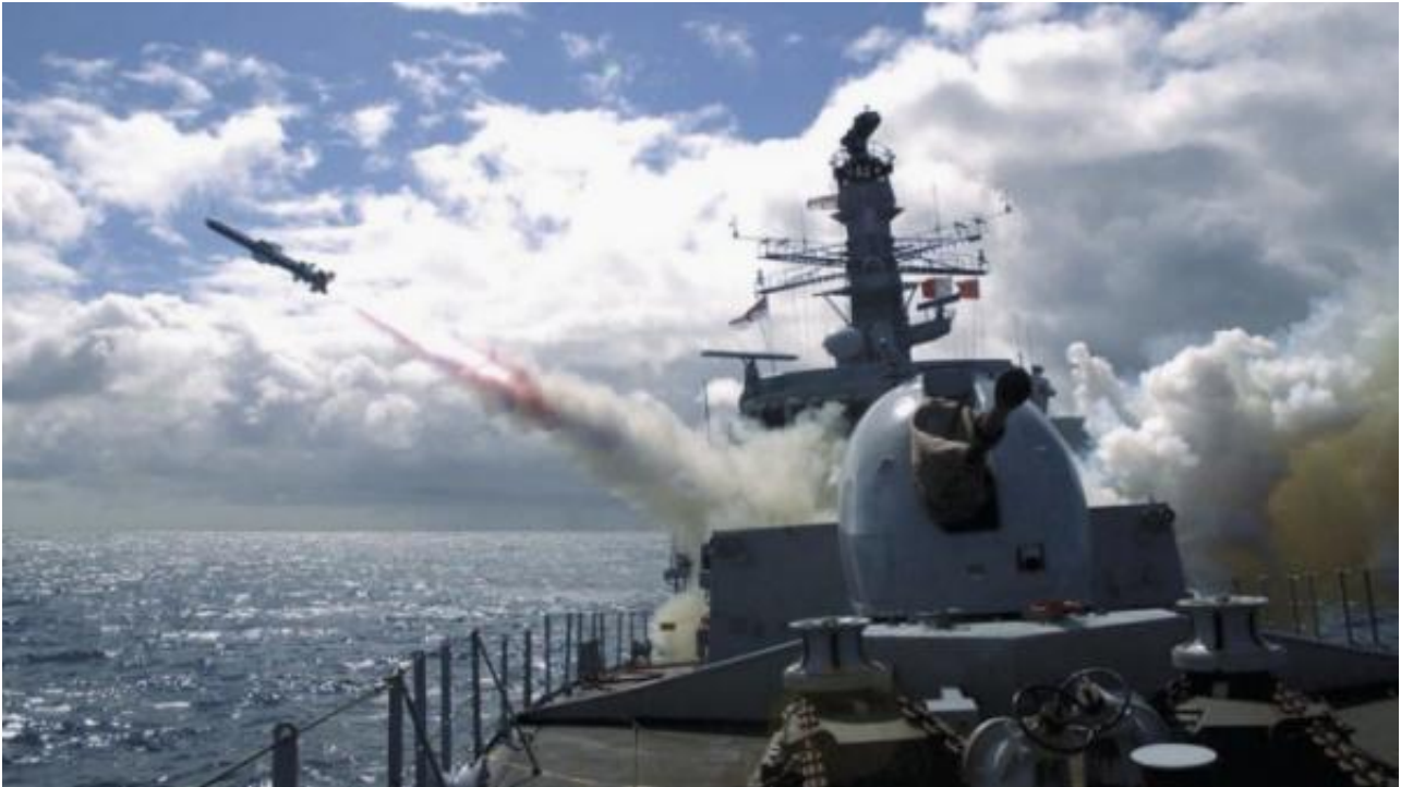
英国海军的“鱼叉”导弹

“鱼叉” Block 1C导弹是一种涡轮喷气发动机动力的掠海反舰导弹，该导弹射程约为130公里，使用雷达制导。